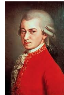
Wolfgang Amadeus Mozart 1756-1791