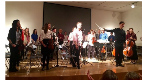
L'orchestre du Lycée Hoche de Versailles