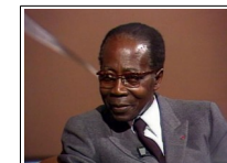
Léopold Sédar Senghor