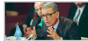
Boutros Boutros-Ghali (1997-2002)