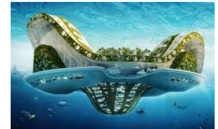
Ville flottante par Vincent Callebaut (architecte belge)