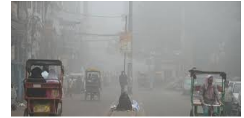
New Delhi sous la pollution