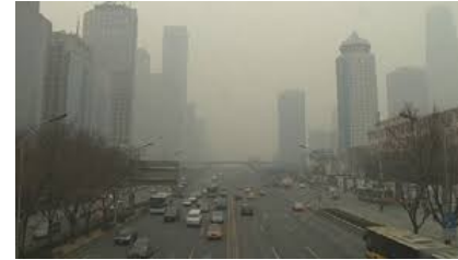
Pékin sous la pollution