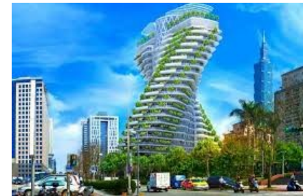
Agora Garden à Taipei (Taïwan) conçue par V. Callebaut