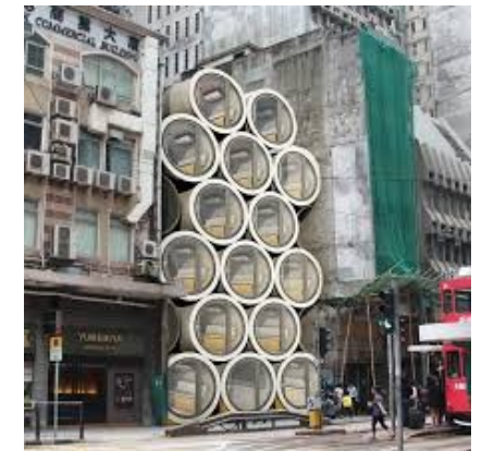
Nano logements à Hong Kong