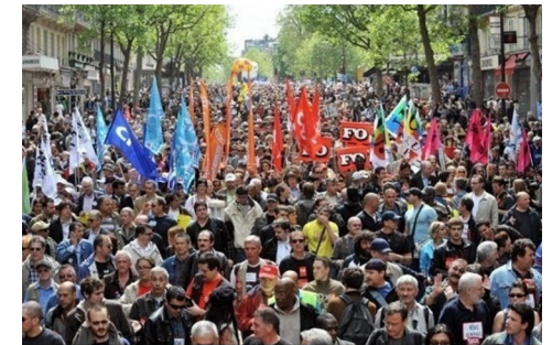
Manifestation syndicale à Paris