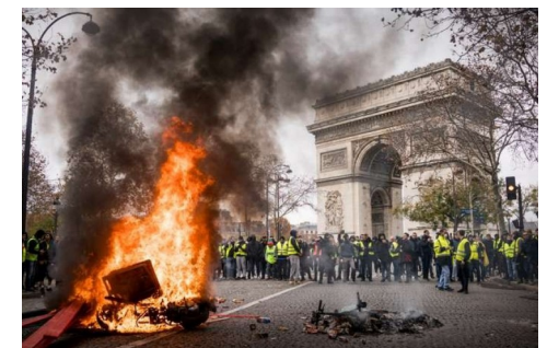
Les Gilets jaunes à Paris le 24/11/2018